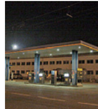
Il distributore rapinato venerdì

Paura tra i commercianti del quartiere dopo i recenti episodi di violenza. «Al tramonto siamo costretti a chiudere a chiave le porte dei negozi».