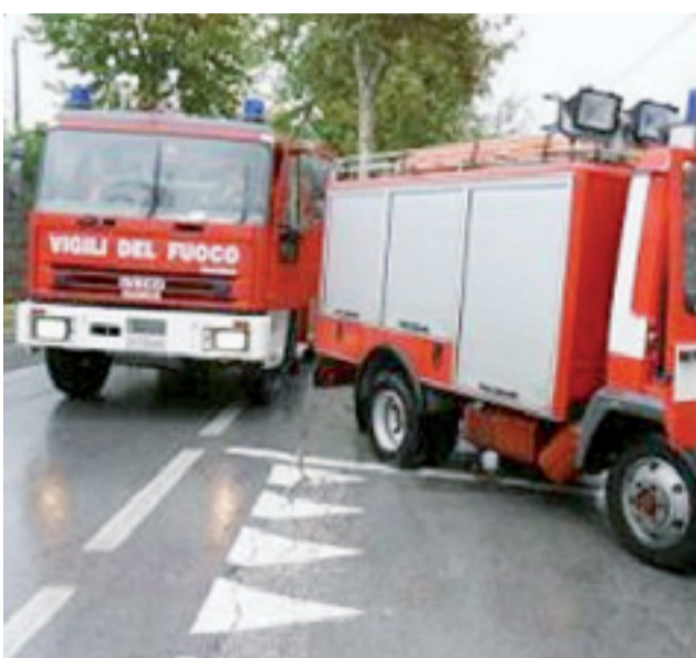
I vigili del fuoco sono intervenuti per domare il principio di incendio

DOMENICA 17 FEBBRAIO 2008 - ANNO II NUMERO 216 (Il giornale € 0,10 + E' in comune € 0,90) € 1,00